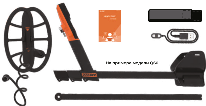
На примере модели Q60